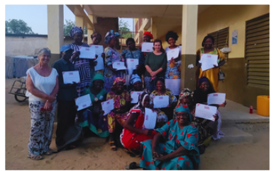
Consegna degli attestati nella capitale N’djamena