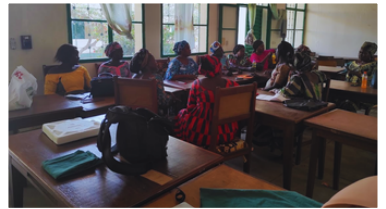
Corso presso l’Ospedale di Sarh, una piccola città del sud-est del paese