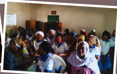
Corso di formazione nel villaggio di Koumra, nel sud del Ciad